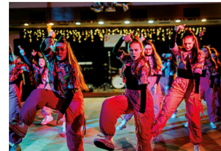
Společensky i vizuálně vydařené plesy vysokomýtské stavební školy se tradičně konají v prostorách M-klubu.