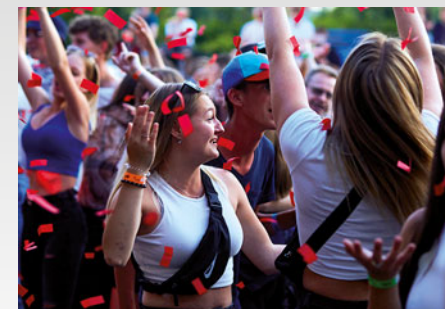
Randálfest – z původně recesistické akce, která měla premiéru v roce 2013, se stal respektovaný multizánrový festival plný soutěží a hudby.

„Většího úspěchu jsem však dosáhl v prvním ročníku v soutěži o Mostuj!, v níž se staví mostní konstrukce ze špejli a kterou pořádá naše škola. Náš tým získal první místo v hodnocení odborné poroty... Vysokomýtská stavebka má vysoký kredit a absolvovat ji, znamená už něco opravdu umět. Určitě chci jít po maturitě na vysokou školu a studovat tam architekturu. Mít své vlastní architektonické studio je i mým snem. Myslím, že je úžasný pocit, když podle mého návrhu vznikne dům, most nebo cokoli jiného, a já si uvědomím, že je to hmatatelný výsledek mé práce,“ vyzdvihuje přednosti své budoucí profese.