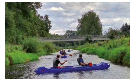
Sportovní kurzy mají základnu v kempu v Kostelci nad Orlicí a jejich součástí bývá také jízda na kánoích.