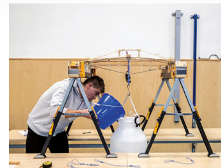
Mostuj! je každoroční školní soutěž, při níž studenti představují své vlastní konstrukce vytvořené ze špejli, lepidla a provázků.